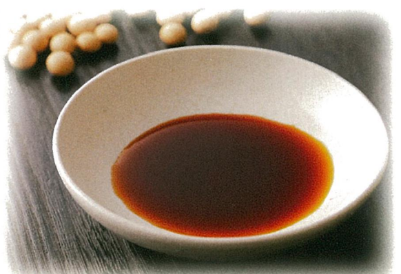
ヤマサ醤油・有明海産焼海苔・ 紀州南高梅詰合せ