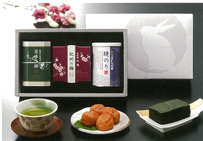
静岡深蒸し銘茶・紀州南高梅・有明海産焼海苔詰合せ