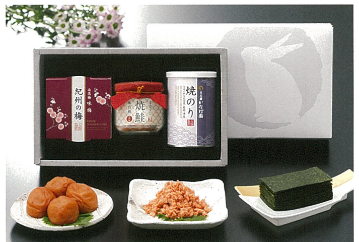
紀州南高梅・焼鮭手ほぐし・有明海産焼海苔詰合せ

内容／上撰やぶ北煎茶60g×1・紀州南高梅(味梅)80g×1・焼海苔8切32枚入×1 箱サイズ／260×153×73mm 入数／20