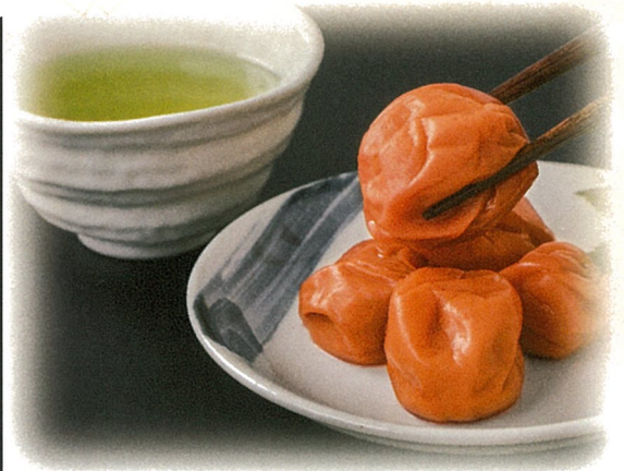
静岡深蒸し銘茶・紀州南高梅・海苔佃煮詰合せ ◆UC-BEN 2,600円(税抜) 2,860円(税込)

内容／上撰やぶ北煎茶70g×1・紀州南高梅(味梅)80g×1 伊勢志摩のり佃煮100g×1 箱サイズ／181×203×62mm 入数／20