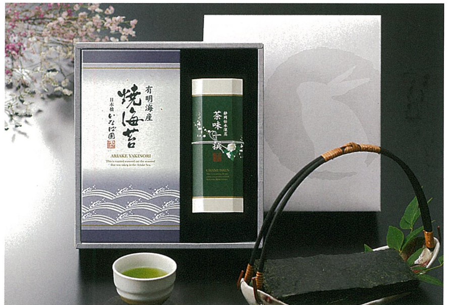
静岡深蒸し銘茶・有明海産焼海苔詰合せ