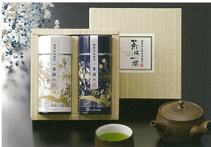
静岡深蒸し銘茶詰合せ