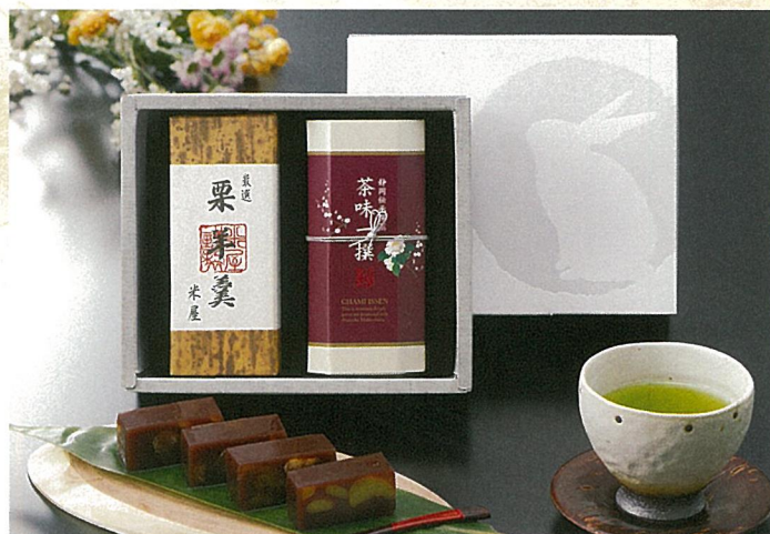
静岡深蒸し銘茶・米屋栗羊羹詰合せ

内容/やぶ北煎茶一番摘み100g×2 箱サイズ/185×188×76mm 木目調紙箱・スチール缶 入数/20