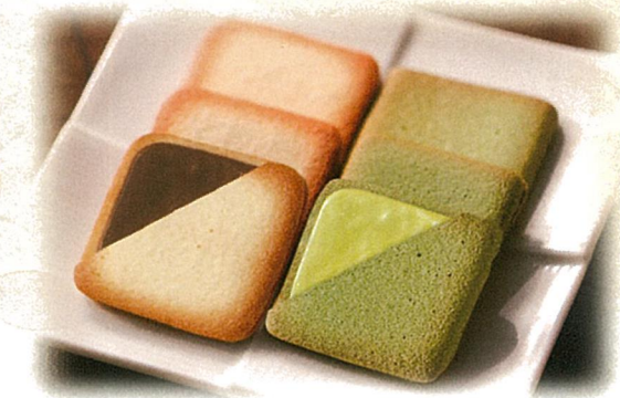
静岡深蒸し銘茶・ドリップコーヒー・ ラングドシャセット