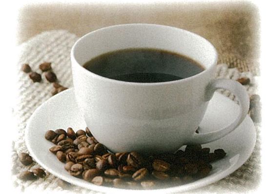
プレミアムティーバッグ煎茶・ ドリップコーヒー・ラングドシャセット