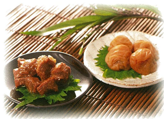
静岡深蒸し銘茶・利久牛たん・ 紀州南高梅詰合せ

内容/やぶ北煎茶一番摘み110g×1・米屋栗羊羹255g×1 箱サイズ/185×153×73mm 入数/20