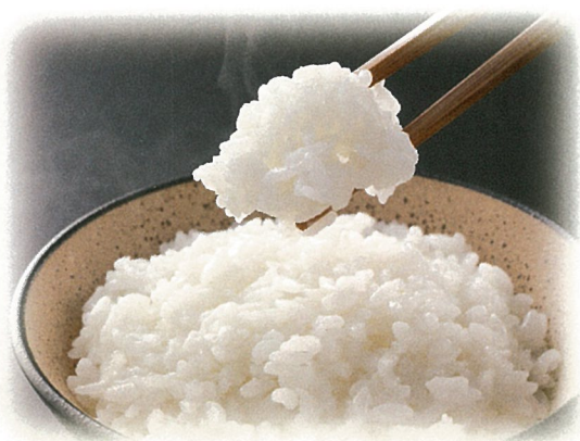
南魚沼産 越しひかりギフト

内容/南魚沼産 越しひかり300g×1 フリーズドライみそ汁(なす・なめこ)×各1 ティーバッグ煎茶(5g×5)×1・紀州南高梅(味梅)80g×1 箱サイズ/240×265×73mm 入数/10