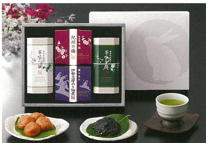
静岡深蒸し銘茶・紀州南高梅・海苔佃煮詰合せ