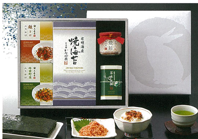
静岡深蒸し銘茶・有明海産焼海苔・大森屋ふりかけ・焼鮭手ほぐし詰合せ

内容/特撰やぶ北煎茶70g×2・紀州南高梅(味梅)80g×1・伊勢志摩のり佃煮100g×1 箱サイズ/255×201×72mm 入数/10