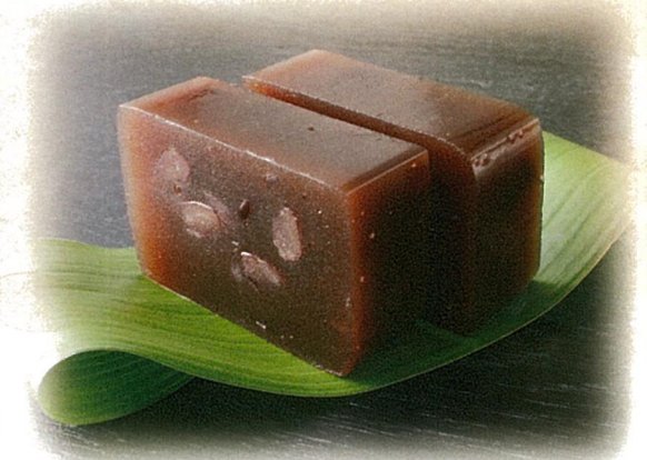
一番摘みティーバッグ煎茶・ 米屋大納言羊羹詰合せ